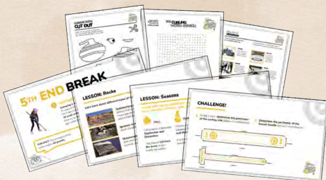
Rocks & Rings dans la salle de classe, module d'apprentissage numérique du curriculum