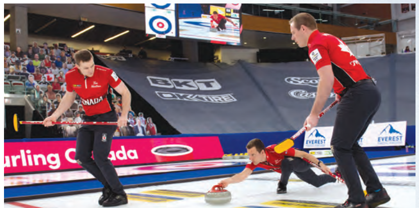
Les résultats confirment que les équipes de haute performance du Canada sont constamment parmi les meilleures au monde.