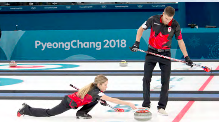
CKaitlyn Lawes et John Morris, du Canada, ont fait fureur ensemble aux Jeux olympiques 2018.

Nous avons l'intention d'être la principale nation de curling au monde, dans toutes les disciplines et de façon continue. Pour y parvenir, nous devons être activement engagés dans de nombreux aspects de nos modèles de développement à long terme, pour les athlètes et les entraîneurs.