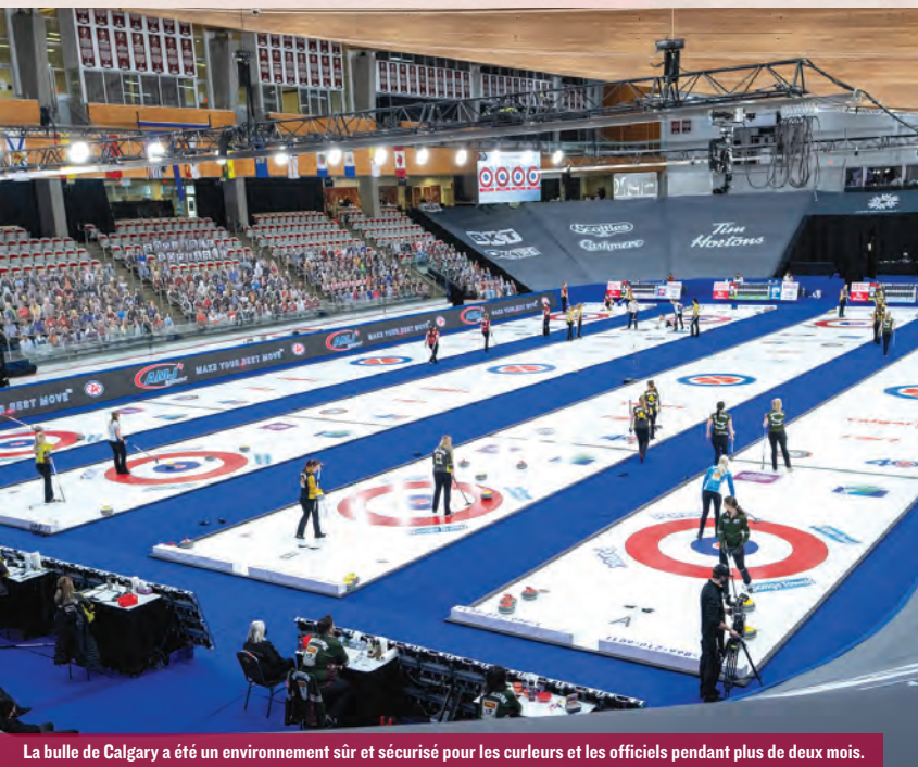
La bulle de Calgary a été un environnement sûr et sécurisé pour les curleurs et les officiels pendant plus de deux mois.

En fin de compte, sept événements ont eu lieu à l'aréna Winsport de Calgary, de la mi-février au début de mai et, pendant toute cette durée, aucun athlète ou membre du personnel travaillant aux événements n'a